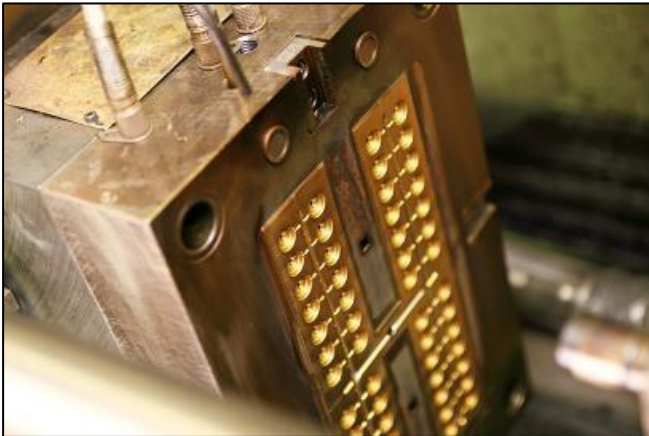
多数個取り金型内ゲートカット仕様

規模の小さな会社ですので、プラスチック関連だけでなく様々なご要望に柔軟でフットワーク良く相談に応えられることが最大の強みです。