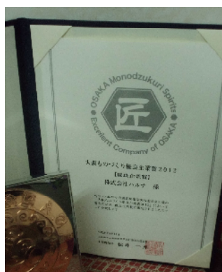
大阪ものづくり優良企業賞の賞

エコマックは実際に使用しないと効果が検証しづらいことから、本社にはエコマックの試作機があり、購入を検討いただいている企業様が実際に試すことができる場所を提供しています。