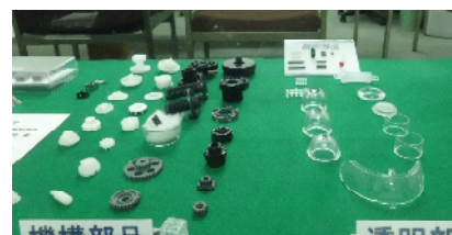
エコマックを使用した成形品

エコマックを使用した成形品は表面転写が良いため、ガラス浮きが少なくなり、成形品からのアウトガスも減少し、二次加工（メッキ、塗装、蒸着）において密着の良い高品質な成形品を製造することが可能です。